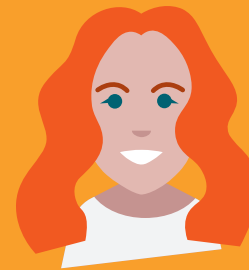
STACEY DOOLEY SGRÙDAIL

Is toigh le daoine practaigeach a bhith ag obair le an làmhnan agus mar sin dh'fhaodte gum bi obraichean far a bheil thu ag obair le uidheaman, innealan, ainmhidhean no lusan a' freagairt riut as fheàrr.