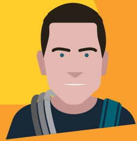
BEAR GRYLLS PRAGTAIGEACH

Bidh Nicola a' cleachdadh a sgilean eagrachaidh san rèisim-trèanaidh aice. Tha na dreuchdan a bhios a' còrdadh ri eagraichean a' gabhail a-steach ag obair le dàta, a' planadh agus a' clàradh.