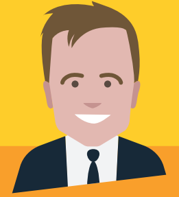
DEC NEACH 'CÒMHDHALACH'

Is toigh le seòrsachan cruthachail a bhith a' dèanamh ghnòthaichean san dòigh a thagh iad fhèin, agus bidh iad a' mealadh obraichean far a bheil dealbhachadh, ealain, sgrìobhadh, ceòl, film no cluiche nan lùib.