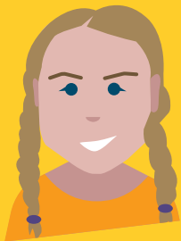
GRETA THUNBERG CEANNARDAN

Tha Greta Thunberg na deugaire Suaineach agus na neach-iomairt. Tha i air obair-ghnìomha a sparradh air ceannardan an t-saoghail barrachd a dhèanamh gus an àrainneachd a dhion, agus tha i air mòran dhaoine a bhrosnachadh bho air feadh an t-saoghail gus pàirt a ghabhail ann a bhith a' togail fianais.